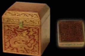
重要文化財 日本国王之印 山口・毛利博物館蔵