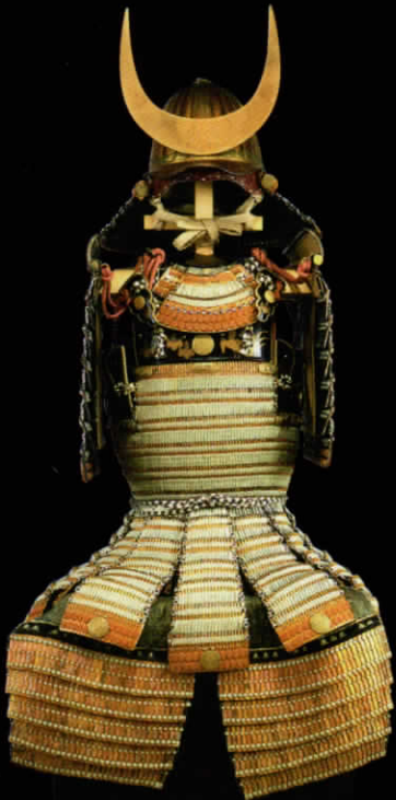
重要文化財 白檀塗浅葱糸威巻 大分・作原八幡宮蔵