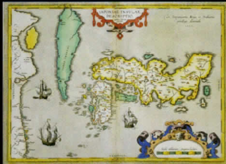
日本図 ルイス・テイセラ作 福岡・九州国立博物館蔵