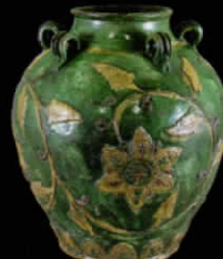
大分市指定文化財 華南三彩貼花牡丹 唐草文玉耳壺 大分・勝光寺蔵 大分市歴史資料館 写真提供